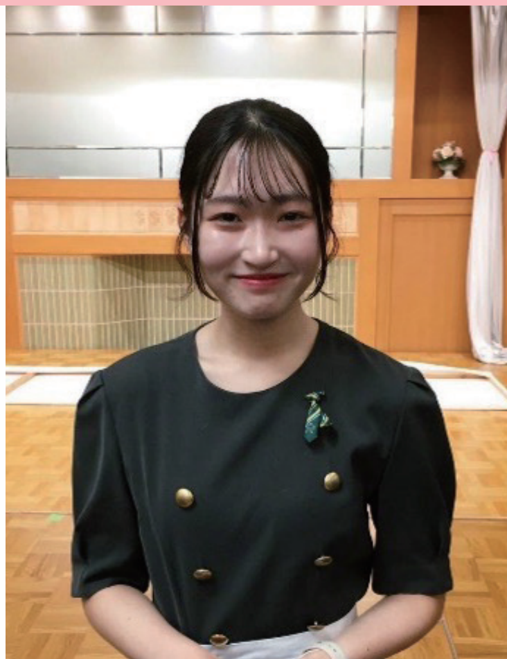
宴会場 アルバイト

大学3年のとき、社会人スキルやコミュニケーションマナーを身につけるために八王子エルシィにアルバイトとして入社。1年3か月の経験を通じて、おもてなしの心と最高の笑顔を身に付けました。飲食業・サービス業未経験だった彼女が、お客様の心を掴む接客力を磨くことができたのは先輩や社員の支えがあったからです。今回は彼女の日々の心がけや印象に残るエピソードについてお話を伺います。