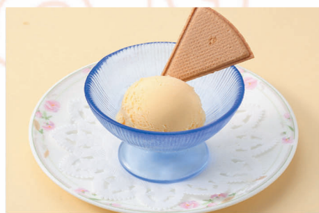
アイスクリーム 400円 (税込)