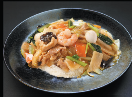
五目あんかけご飯