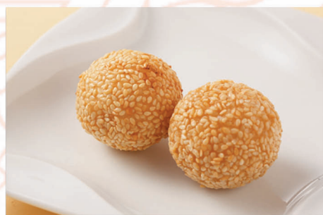
餡入り胡麻団子 1個 200円 (税込)