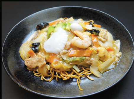
五目あんかけ焼きそば