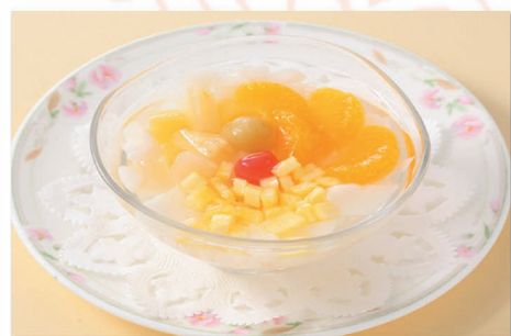
フルーツ入り杏仁豆腐 400円 (税込)