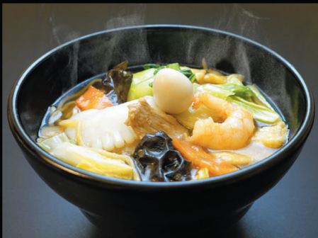
五目あんかけつゆそば