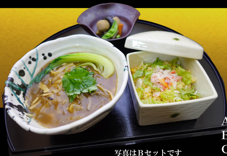
写真はBセットです

豊かな海の香りとともに、コクのあるスープが、口の中に広がり一口ごとに深い味わいを楽しめます。この特別なそばをぜひご賞味ください。