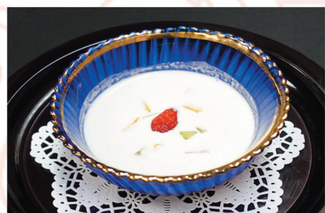
小豆、フルーツ入りココナッツミルク 500円 (税込)