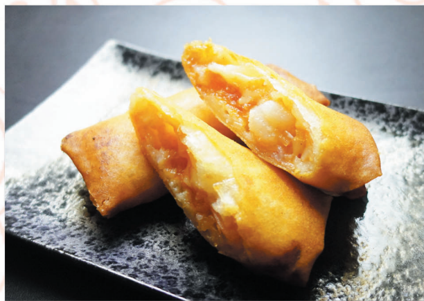
チーズ入り海老チリ春巻き